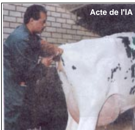
Acte de l'IA

d'action. Certains postes d'intervention gérés par les services d'élevages sont fixes; l'éleveur doit se déplacer chez l'inséminateur pour faire inséminer ses vaches.